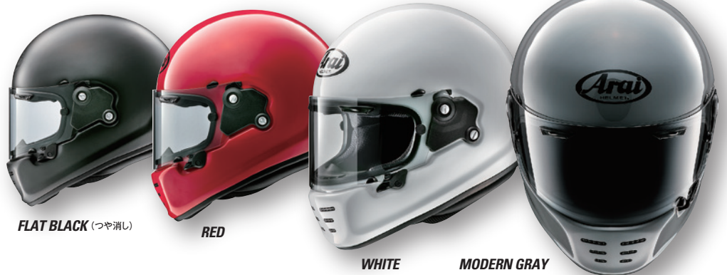
FLAT BLACK (つや消し)